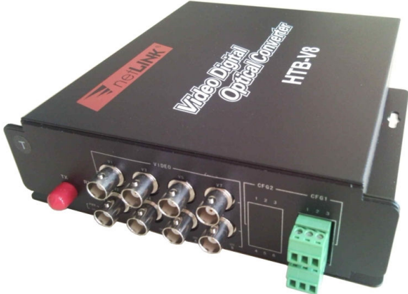
8 Kanal Video+PTZ