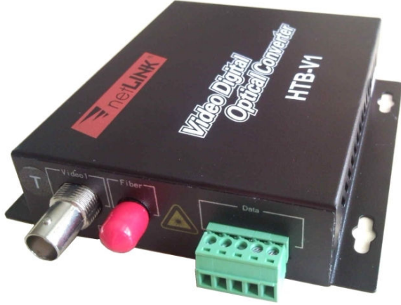
1 Kanal Video+PTZ